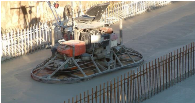
Figuur 3. Vlindermachine

Direct na het storten van beton voor de vloeren en dekken wordt gevlinderd. Vlinderen is het egaliseren en afwerken van een vers gestorte betonvloer. Het wordt toegepast om de toplaag te verdichten en goed te laten hechten aan de onderlaag van het beton. Voor het vlinderen wordt een vlindermachine gebruikt (zie figuur 3).