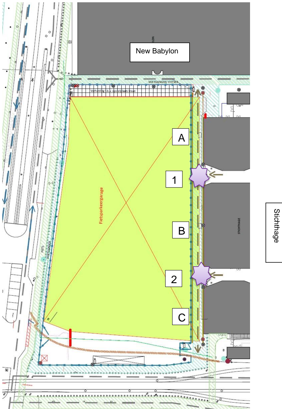
Figuur 1. Werkvakken en schuifdeuren