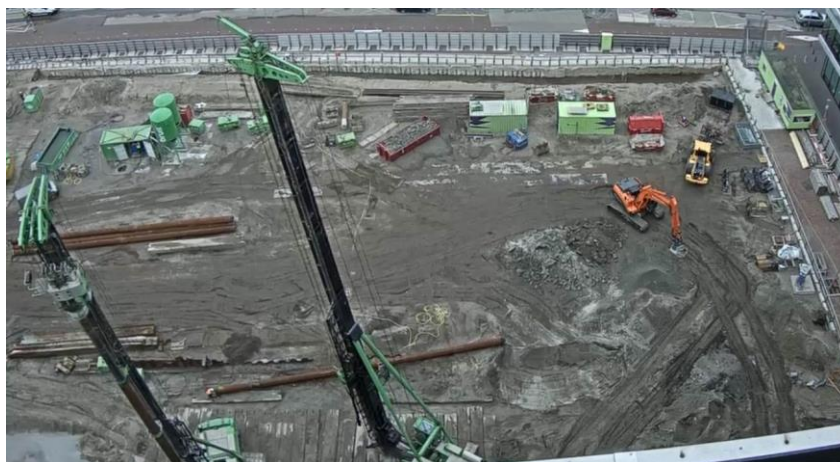
Afbeelding 1. Bouwplaats met stellingen voor funderingspalen

Op donderdag 21 september is de laatste funderingspaal de grond in gegaan. In totaal staan nu ongeveer 600 funderingspalen op het bouwterrein.