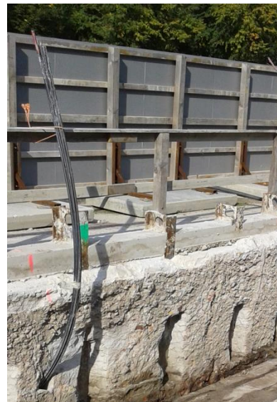
Afbeelding 3. Verbindingstunnel New Babylon